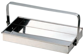
①EBM 18-0 お好み岡持ち