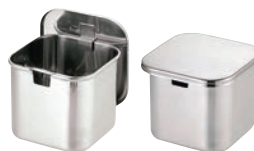
③UK モリブデン 角タレ入