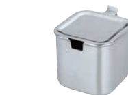
④UK モリブデン 角タレ入 (丁番付き)