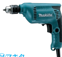
㉔マキタ 電動式ドリル 6412