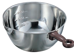
① 18-8 目盛付 手付 片口 ボール