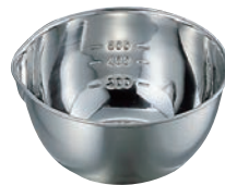
② 18-8 目盛付 片口 ボール

●目盛付 大目盛:500cc・1,000cc・1,500cc 中目盛:300cc・600cc・1,000cc 小目盛:200cc・400cc・600cc