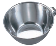
⑤ 18-0 お好みカップ

●目盛付 15cm目盛:200cc・400cc・600cc 18cm目盛:300cc・500cc・1,000cc