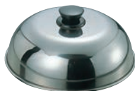
⑭ EBM 18-0 PC柄 丸カバ