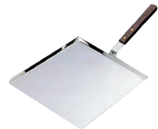
⑯ EBM 18-0 お好みちり取