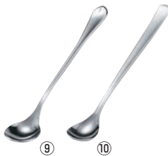
⑨ EBM 18-8 リモージュ ソーダスプーン