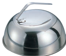
⑮ EBM 18-8 共柄 丸カバ 26cm