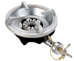
④フラッシュ ガスコンロ FG-1型 ㊦ (1重バーナー、平型ゴク) ●パイロット(種火付) ※平型ゴクのみ仕様です。