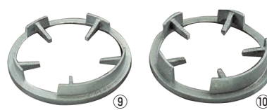
⑨TG・FG 兼用 立型ゴク ㊦ ㊦