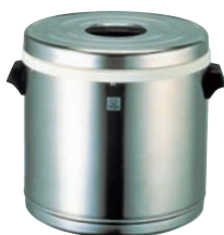
②タイガー 業務用 ステンレス 保温ジャー