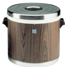
①タイガー 業務用 保温ジャー (木目)