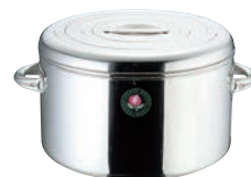
③18-8 モモ ライスジャー