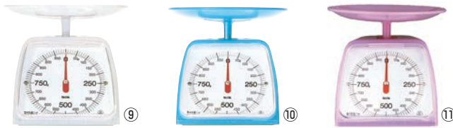
タニタ クッキングスケール 1kg KA-001