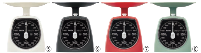
タニタ アナログクッキングスケール 2kg KA-442