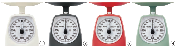
タニタ アナログクッキングスケール 1kg KA-441