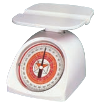
⑱タニタ レタースケール