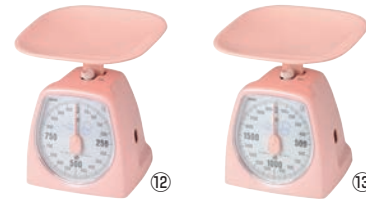
タニタ アナログクッキングスケール