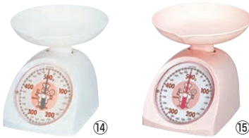
タニタ ベーキングスケール 「コックさん」500g No.1345