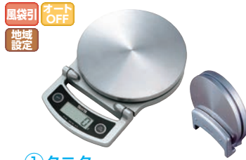
①タニタ クッキングスケール 2kg ㊦