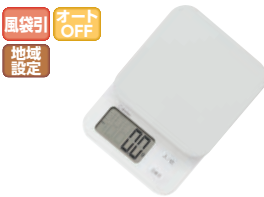
⑦ドリテック デジタルスケール 「ブランジェ」2kg ホワイト ㊦

●追加計量に便利な、オートゼロモード付 ※材料をはかりに乗せて、4秒後に自動的に0になります。 ●各材料の正味量が確認できる計量確認機能付