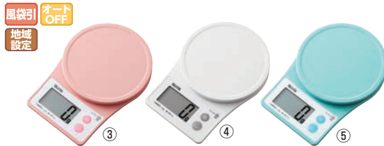
タニタ クッキングスケール 2kg KJ-216 ㊦