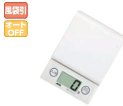
⑥A&D ホームスケール 2kg ホワイト ㊦