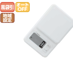
⑧ドリテック デジタルスケール 「プロット」2kg ホワイト ㊦

●起動時間が早いから待たずにすぐ使える(当社比) ●安心して使える滑り止め付 ●立てて収納できるから置き場所に困らない ●0.1g単位ではかれる(0.3~300gまで) ●はしで洗えるシリコンカバー付 ●大きな計量皿、ボタン、液晶画面で使いやすい ●便利な壁掛け用フック穴付 ●計量範囲:0.3~2,000g