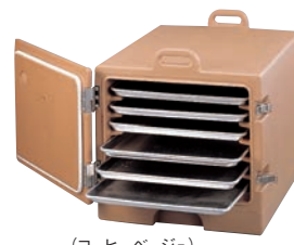
(コーヒーベージュ)