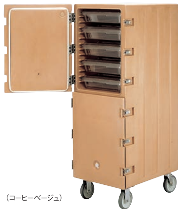
(コーヒーベージュ)