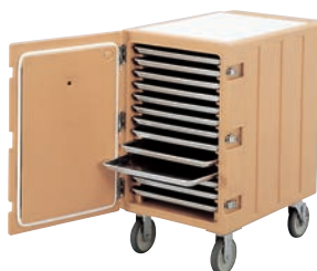
(コーヒーベージュ)