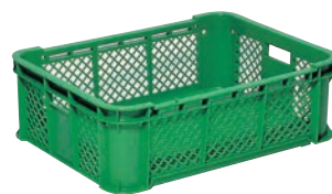
⑦ サンコー コンテナ グリーン