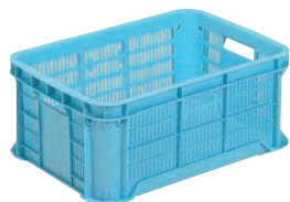
⑨ サンコー コンテナ ブルー