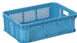
① サンコー コンテナ