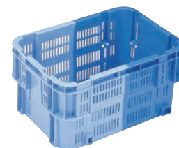
⑯ リス コンテナ