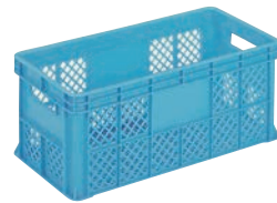
⑧ サンコー コンテナ ブルー