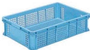
⑤ サンコー コンテナ