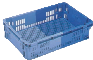
⑮ リス コンテナ