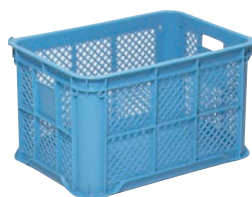
③ サンコー コンテナ