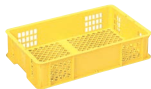
⑩ サンコー コンテナ イエロー