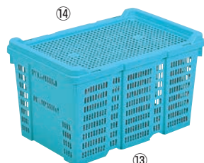
⑬ サンコー コンテナ用蓋 ブルー