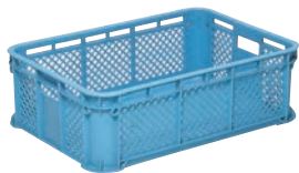
② サンコー コンテナ