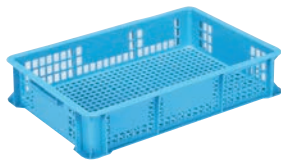
⑥ サンコー コンテナ