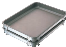
⑫IKD アルミフッ素加工 餃子&生鮮バット

●フッ素樹脂加工により食材がくっつきにくく、お手入れが簡単です。酢・酸等に対する耐久性も抜群です。