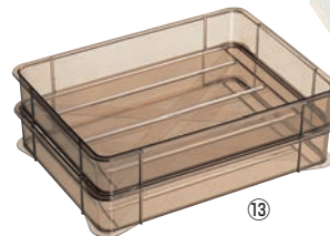
⑬ポリカーボネート 万能バット

●フッ素樹脂加工により食材がくっつきにくく、お手入れが簡単です。酢・酸等に対する耐久性も抜群です。