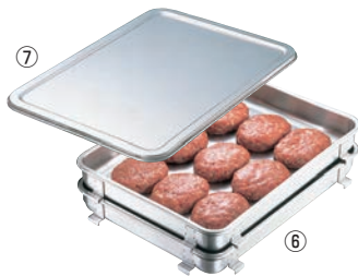
⑥IKD 抗菌ステンレス 生鮮バット