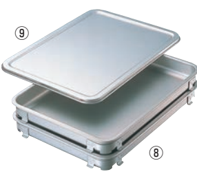
⑧IKD アルマイト 餃子&生鮮バット