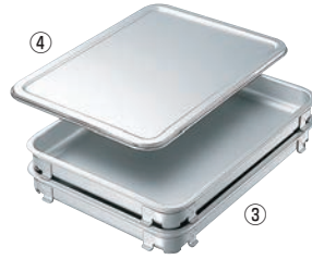
③エコクリーン アルミ 餃子&生鮮バット