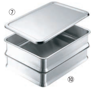
⑩IKD 抗菌ステンレス スタッキング角バット