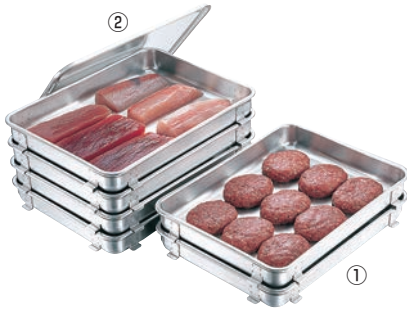
①エコクリーン 18-8 生鮮バット