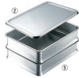
⑤エコクリーン 18-8 スタッキング角バット