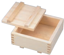
①EBM ひのき 押し枠