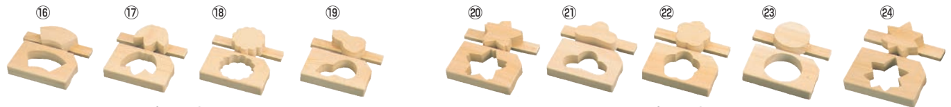
EBM ひのき 押し型