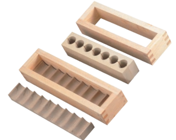
⑨EBM 木製 幕の内 押し型