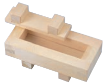
⑤EBM ひのき 大阪寿司 1ツ山