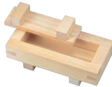
⑥EBM ひのき 大阪寿司 2ツ山