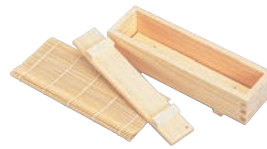
⑭木製 太巻き寿司セット