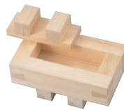
②EBM ひのき バッテラ