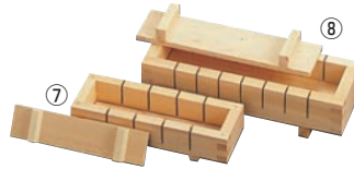
⑦EBM ひのき 押し寿司 五ツ切