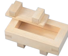
③EBM ひのき さば寿司