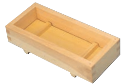
⑬ひのき 押し寿司器