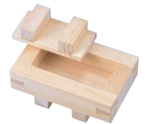
④EBM ひのき 箱寿司