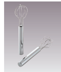
⑯18-8 パイプ柄 味噌取マドラー