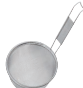
⑦18-8 万能こし (12メッシュ)