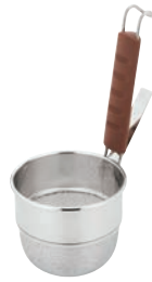
③UK 18-8 シリコン柄 みそこし