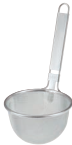
②18-8 プロみそこし (16メッシュ)