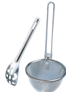
⑥18-8 共柄 みそこし (スプーン付)