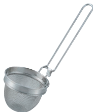
⑭18-8 共柄ミニ味噌こし (14メッシュ)