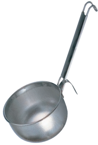
①UK 18-8 パンチング こしテボ