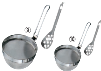
18-8 共柄万能こしセット (レンジ付)