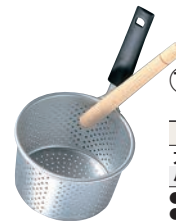
⑬アルマイト PC柄 みそこし (こし棒付)