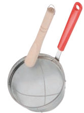
⑧万能こし (すり棒付)