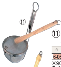
⑪18-8 ふた付 みそこし (こし棒付)