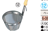
⑫夕華 18-8 みそこし