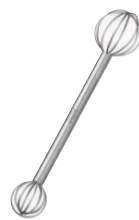
⑮計量みそマドラー