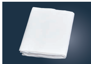
⑥ EBM ネル地 だし布

ページコード 商品コード 価格 6-0601-0501 3076200 ¥7,500 幅110cm×10m巻 材質:綿100% ●ガーゼ生地を少し丈夫にしたような生地 ●肉を包む・味噌漬け・スープに最適です。