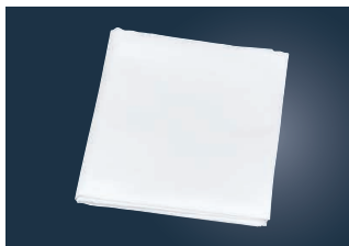
⑨ EBM メッシュ だし布

ページコード 商品コード 価格 6-0601-0901 3076400 ¥8,300 幅122cm×5m巻 材質:ポリエステル100% ●目が粗いので大粒な食材を漉すのに使えます。 ●目の粗いスープ物に最適です。