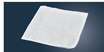
⑧ EBM カットガーゼ (10枚入)

ページコード 商品コード 価格 6-0601-0701 7345000 ¥1,600 幅30cm×10m巻 材質:綿100%