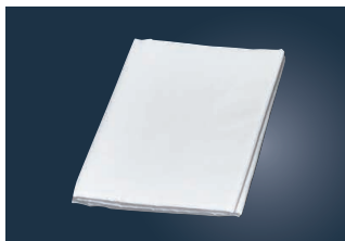
⑤ EBM 寒冷紗

ページコード 商品コード 価格 6-0601-0501 3076200 ¥7,500 幅110cm×10m巻 材質:綿100% ●ガーゼ生地を少し丈夫にしたような生地 ●肉を包む・味噌漬け・スープに最適です。