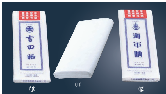
⑩ EBM さらし (吉田晒)

ページコード 商品コード 価格 6-0601-0901 3076400 ¥8,300 幅122cm×5m巻 材質:ポリエステル100% ●目が粗いので大粒な食材を漉すのに使えます。 ●目の粗いスープ物に最適です。