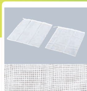
④ EBM ガーゼだしこし