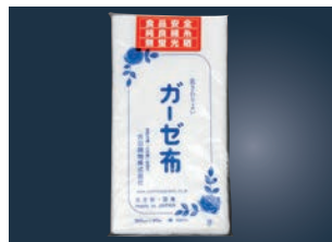
⑦ EBM ガーゼ布 (吉田晒)

ページコード 商品コード 価格 100cm×1m 6-0601-0601 3078200 ¥2,900 100cm×5m 6-0601-0602 3076300 ¥13,500 材質:綿100% ●目の細かいスープ物に最適です。