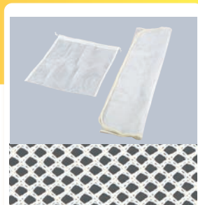
② EBM ネットだしこし