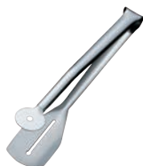
⑪ 18-10 バッフェ トーストトング