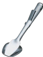
② 18-10 クリップ型 サービストング