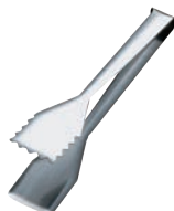
⑫ 18-10 バッフェ トング