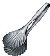
⑨ 18-10 シェル型 ブレッドトング