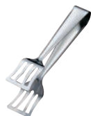
⑧ 18-10 ベストリートング