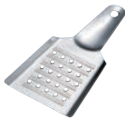
④ステンレス 岩塩専用卸金