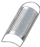
⑩18-0 チーズ卸金 特大