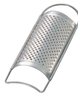
⑪18-8 IKD 抗菌 万能 卸金