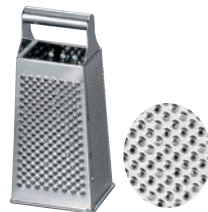
⑦四面 チーズ卸器 大