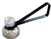
⑭エッグハンマータッチ