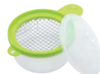
⑯サンドイッチ用 玉子メーカー