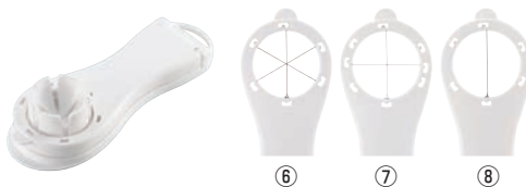
縦切りエッグカッター