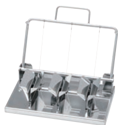
②18-8 縦割三連 エッグカッター