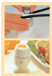
⑮うずらカッター プッチ