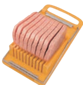
⑤ランチンミートスライサー