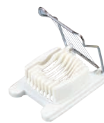
④玉子切器 PC台 (8本線)