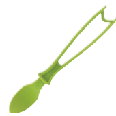
⑫リンデンヨナス PP エッグピーラー