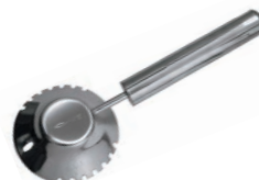
⑫18-8 うろこ取り 銀鱗