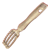
⑤堺孝行 真鍮 共柄 ウロコ取り