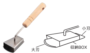
⑥飛び散らないウロコ取り