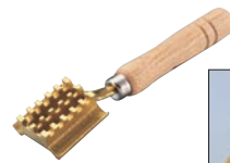
④業務用 テーパー形 羽根付ウロコ取り