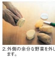
2. 外側の余分な野菜を外します。