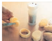
5. フォークやナイフで内側を取れば野菜の器のできあがりです。