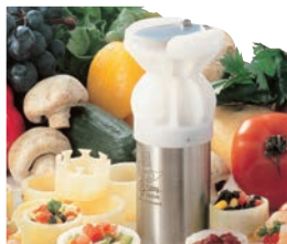
ターンナップで抜いた野菜のデコレーションやフルーツの飾り切りに。