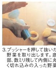
3. プッシャーを押し抜いた野菜を取り出します。底部、数ミリ残して内側に丸く切れ込みの入った野菜が出て来ます。