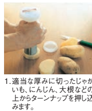
1. 適当な厚みに切ったじゃがいも、にんじん、大根などの上からターンナップを押し込みます。