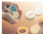
4. ターンナップのグリップ部に付いている底抜き用の刃を捻らず真っ直に切れ込みの入っていない方の底にしっかり差し込みます。