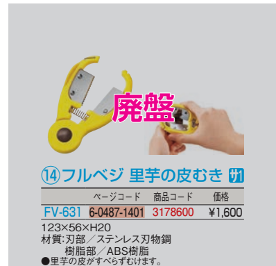
⑭フルベジ 里芋の皮むき