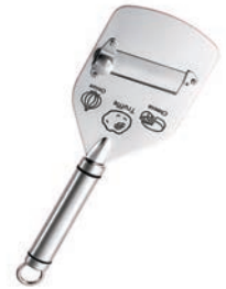
⑦トリュフスライサー