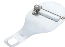
⑥LT 18-10 トリュフ (きのこ) スライサー

外寸:213×24×H18 材質:刃/ステンレス刃物鋼 ハンドル/18-8ステンレススチール 回転軸/ステンレススチール 安全ケース/ポリプロピレン ●皮むき・ささがき・スライスができ、野菜の下ごしらえがピーラーにできます。