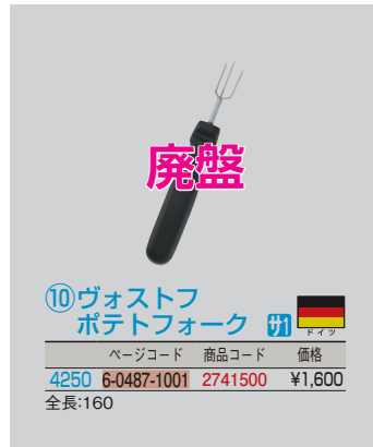
⑩ヴォストフ ポテトフォーク