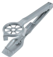
⑫ウエストマーク ラディッシュカッター

27×177 刃渡:35 ●2mm間隔に8枚の刃がついていて、ピクルスやきゅうりの飾り切りに大変便利です。