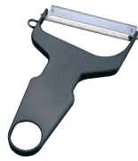
①キンピラごぼうピーラー