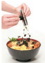
⑧もみのりカッター 海苔吹雪