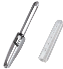
⑤ロングピーラー+プラス (安全ケース付)

外寸:210×26×H12 材質:刃部/ステンレス刃物鋼 縦刃部/ステンレスハネ鋼 柄部/18-8ステンレススチール 安全ケース/ポリプロピレン ●きんぴらやサラダ、コールスローがこれ1本でできます。巾約3mmの千切り・粗みじんが均一にできます。