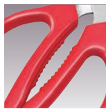
オープナーとして 使用できます。