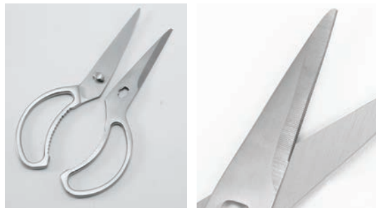
分離できるので洗浄が簡単で衛生的。 細かなギザ刃で食材をキャッチ。すべらず切れます。

分解洗浄ができるので汚れがたまりにくく清潔です。 カラーは5色展開なのでアレルギー対策にも対応します。 食材による色分けが可能なので食中毒予防にも使用できます。