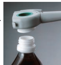
キャップオープナー φ23~31