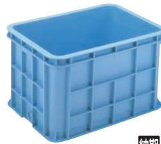
⑧スーパーボックス 200