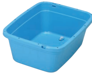
⑤トンボジャンボタライ 角型 水抜栓付