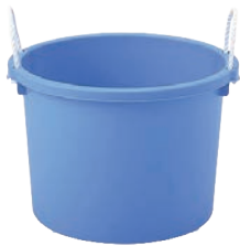
④サンコー タブ #30L (ロープ付)