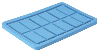
⑦スーパーボックス500用蓋

※スーパーボックスは、3つのオプションが取り付けできます。 ※⑥はフロ栓とキャスターは同時装着できません。 ※標準のキャスターは4インチとなります。