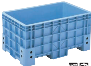
⑥スーパーボックス 500

材質:本体/ポリプロピレン 水抜き栓/ポリエチレン 耐熱温度:本体/-20~120℃ 水栓/-30~90℃ ●ホース穴(60型1ヶ所、80型・120型2ヶ所)