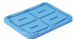
⑨スーパーボックス200用蓋