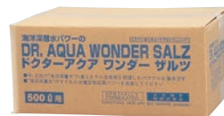
⑩ドクターアクア ワンダーザルツ 500ℓ用(人工海水)