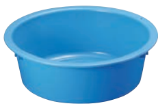
①リス GK タライ