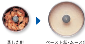
蒸した鮭 ペースト状・ムース状