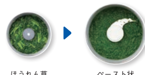
ほうれん草 ペースト状