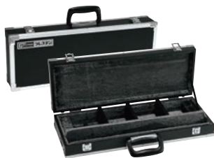
⑥ グレステン 庖丁ケース 中 ㊦