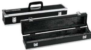
⑦ グレステン 庖丁ケース 小 ㊦