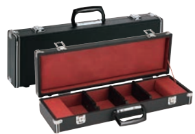
⑨ 料理学校用 庖丁ケース 6丁入