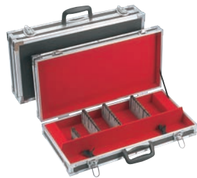
① スペシャルグレード ハードタイプ ナイフケース 大 ㊦