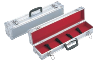
④ スペシャルグレード シルバー ナイフケース 小 ㊦

フリー 外寸:570×125×H100 内寸:550×108×H 75 ※P326-②の庖丁巻などと組み合わせでのご利用をお薦めします。 ※刃渡36cmまで収納可能 鍵付