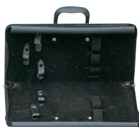
⑩ 学校用 庖丁ケース (5丁入) ㊦