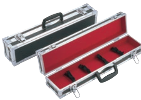
③ スペシャルグレード ハードタイプ ナイフケース 小 ㊦

10丁入 外寸:570×285×H100 小物収納スペース:550×90×H50 材質:ジュラルミン製 ※刃渡36cmまで収納可能 鍵付