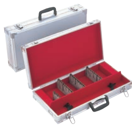
② スペシャルグレード シルバー ナイフケース 大 ㊦

10丁入 外寸:570×285×H100 小物収納スペース:550×90×H50 材質:ジュラルミン製 ※刃渡36cmまで収納可能 鍵付