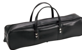
⑫ レザー ポストン型 庖丁ケース 黒 ㊦