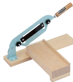
⑩かきもち用 もち切り 画