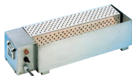
⑧電気式 ナイフウォーマー 画