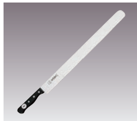
⑤一角別作 黒合板 カステラナイフ 直刃 画