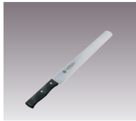
①堺孝行 カステラナイフ (ステンレス鋼) 直刃 画