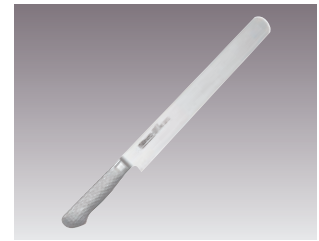
④ブライトM11PRO カステラナイフ 画