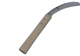
⑭バナナ切り庖丁 画