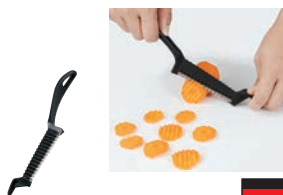
⑫WM ベジタブルカッター 3120