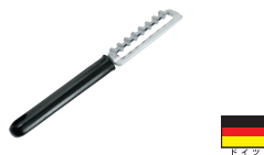
⑬WM クリンクルカッター 8365