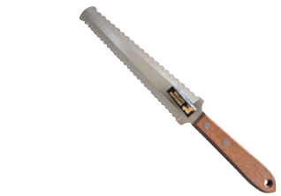
⑮アイガブロケードカッター 画