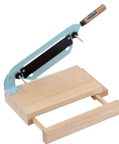
⑨のしもち用 もち切り 画