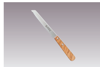
⑩ジャン・ネロン ブレッドナイフ ショートオリーブ 国産