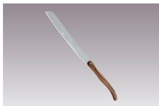
⑨ジャン・ネロン ブレッドナイフ オリーブ 国産