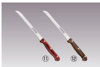
トラモンティーナ ボリウッドブレッドナイフ