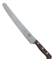
⑤ビクトリノックス ウッドベーストリーナイフ 5.2930.26 国産