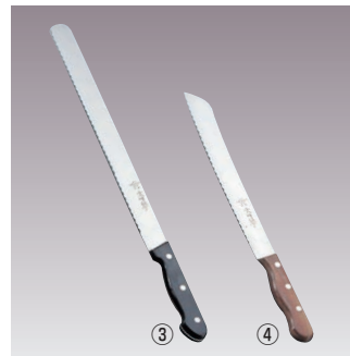
文明銀丁 パン切ナイフ (モリブデン鋼)