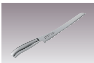
⑬プレミオ パンナイフ 31803 国産