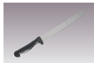
⑭黒プラ柄 パン切ナイフ 30891