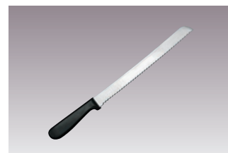
⑦黒柄 パン切ナイフ 国産