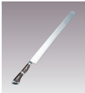
②YA ロイヤル パン切ナイフ 国産