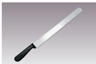
⑥ウェーブ パン切ナイフ 国産