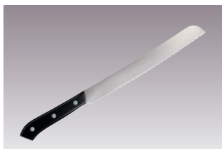
⑧ニューエーデルワイス パン切庖丁 NO180 国産