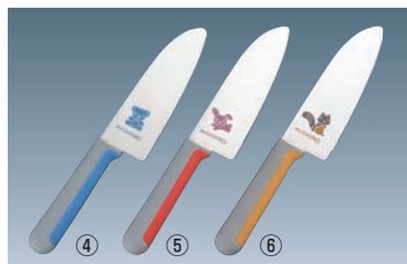
正広 こども庖丁 両

材質:刃部/モリデバンバナジウム鋼 ハンドル/エラストマー樹脂 ●小さい手でもしっかり握れるように少し小さめなハンドルです。