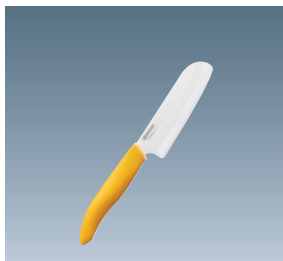
①京セラ ファインセラミック おやこでクッキング こども用ナイフ 両