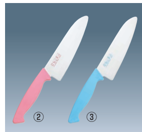
チャイルド庖丁 両