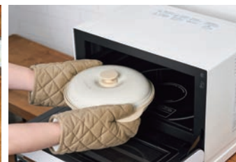
レンジでチンするだけの簡単調理