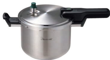
①ワンダーシェフ Pro2 圧力鍋 6.0ℓ (ZPSA60)