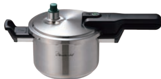
②ワンダーシェフ Pro2 圧力鍋 3.0ℓ (ZPSA30)