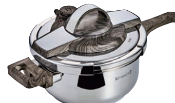
⑥ケプンハウ ステンレス圧力鍋 4.0ℓ KVPC40

付属品:掃除ピン・蒸しす・レシピブック・取扱説明書 ●140kPaと80kPaの圧力2段階切り替え