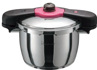
④ワンダーシェフ 魔法のクイック料理5.5ℓ (ZQDA55)

付属品:掃除ピン・蒸しす・取扱説明書 ●本体が全面三層構造なので熱の伝わりが均一で早いので省エネです。 ●本体が全面三層なので軽量(当社比) ●他社にはない超高压140kPa