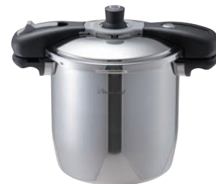
③ワンダーシェフ 魔法のクイック料理8ℓ (NQDA80)