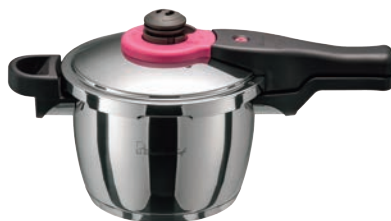
⑤ワンダーシェフ 魔法のクイック料理3ℓ (ZQSA30)

付属品:掃除ピン・蒸しす・レシピブック・取扱説明書 ●140kPaと80kPaの圧力2段階切り替え