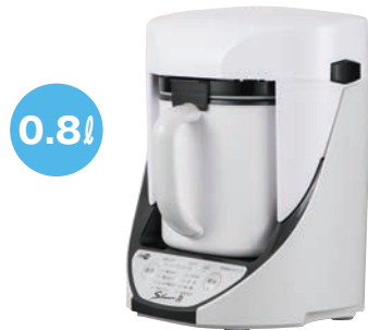
⑨クックマスター 旬彩Pro YE-CM17B

独自特許技術による 薄型・高性能モーターで自動かくはんを実現 加熱しながら調理できる。