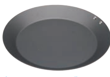
⑦ ココパン モーニング