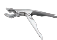
⑪ 18-8 パングリッパー 平型