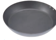
⑧ ココパン プレミアム