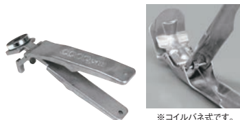
⑩ アルミ パングリッパー (マグネット付)