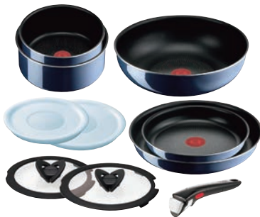
⑦ ロイヤルブルーインテンス セット10