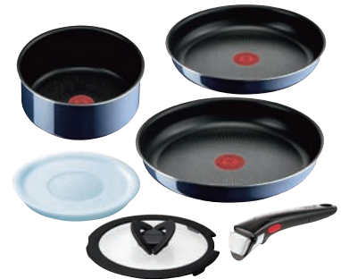
⑨ ロイヤルブルーインテンス セット6