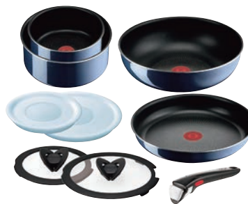
⑧ ロイヤルブルーインテンス セット9