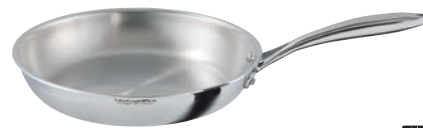
⑥ フライパン (フタ無)