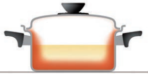
全面多層構造のビタクラフト 側面にも効率よく熱が伝導