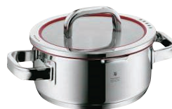
④WMF ファンクション4 ローキャセロール