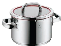
③WMF ファンクション4 ハイキャセロール