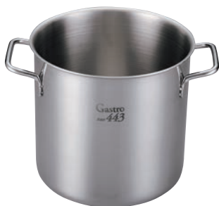
①EBM ガストロ 443 寸胴鍋 蓋無(目盛付)