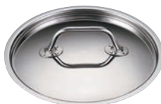
⑤EBM ガストロ 443 鍋蓋