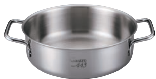
③EBM ガストロ 443 外輪鍋 蓋無(目盛付)