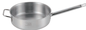
④EBM ガストロ 443 浅型片手鍋 蓋無(目盛付)