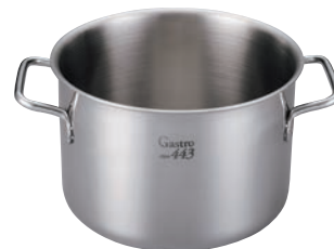
②EBM ガストロ 443 半寸胴鍋 蓋無(目盛付)