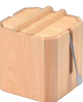
丸 ガリ入れ トング付