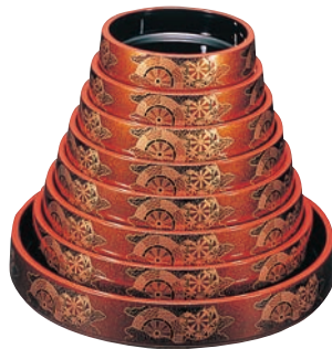
⑩寿し桶 梨地御所車