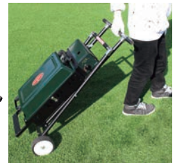
移動、持ち運びも楽々