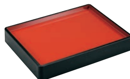
②長手両面番重 黒内朱 尺1寸