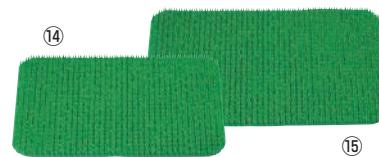
パイレス専用 肉芝 B型