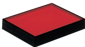
①サンコー ABS 朱塗 番重 わじま (両面使用型) 加