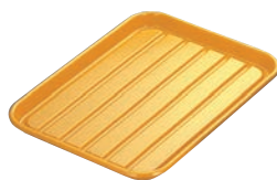
⑧パイレสบット大