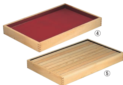
④ひのき 角型 盛盆 深朱浅黒 520