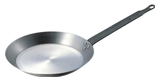
④SW 鉄 クレーパン