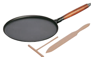
⑦ストウブ クレーパン 木柄 ブラック 28cm 40509-525