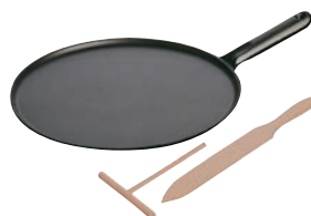
⑧ストウブ クレーパン 30cm 40509-526