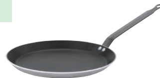
③デバイヤー アルミニウムノンスティック クレーパン 8185