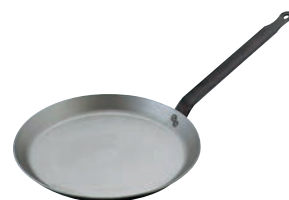
⑥マトファー 鉄 クレーパン