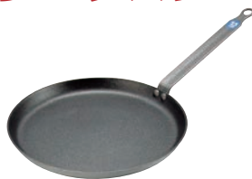
②ブウジャ アルミニウムノンスティック クレーパン 6661