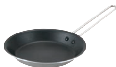
①EBM プロスタンダード 2PLY オムレツパン