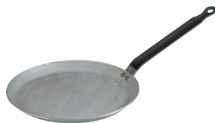
⑤デバイヤー 鉄 共柄 クレーパン 5120