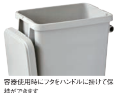
容器使用時にフタをハンドルに掛けて保持ができます

材質:本体・フタ/ポリプロピレン 排水栓/ポリエチレン キャスター/銅+エラストマー(自在×4、ストッパー2ヶ付)