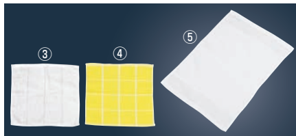
おしぼりタオル #80 (12枚入)