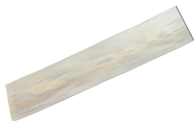
⑮経木うす板 (1束=100枚入)