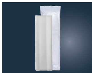
⑫バルブ不織布おしぼり 平型 超大判 (70本入×10袋) 300×265

材質:バルブ不織布 ●両手を覆う超大判で贅沢な使い心地 ●温めても冷やしても使えます。