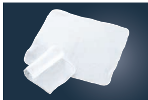
①EBM 高級タオルおしぼり No.170 (12枚入) ホワイト