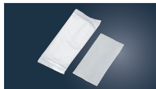
⑬パールフィルム おしぼり (2,000本入)