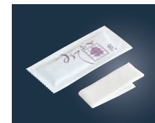
⑭ミニおてふき C型 (400枚入)

200×200 1ケース:100本×20袋 原反:スパンレース(レーヨン)60g素材