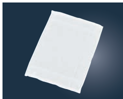
②EBM タオルおしぼり No.80 (12枚入り) ホワイト

340×340 材質:綿100% ●シャーリング加工で手ざわりが良く高級感があり、吸水性にも優れています。 ●オーバーロック巻