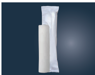
⑪バルブ不織布おしぼり 丸型 超大判 (50本入×12袋) 350×295