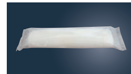
⑩使い捨ておしぼり エマーブルフリー 丸型大判 (700本入)