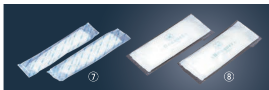
⑦紙おしぼり エレガンス ロールタイプ (1,000本入)