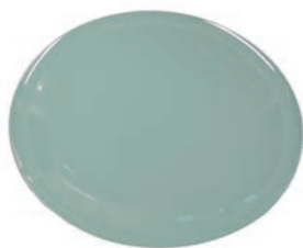
①高台皿 (5枚入) 青磁