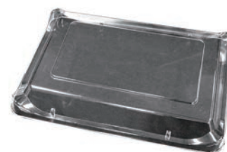
⑨筑後用 長方形 蓋 (10枚入)