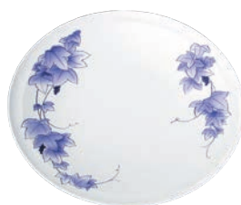
②高台皿 (5枚入) ぶどう