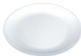
⑤丸皿 白 (10枚入)