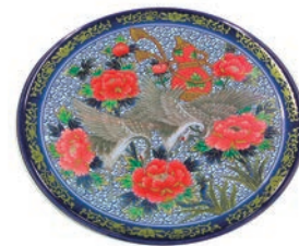
③高台皿 (5枚入) 紺 有田