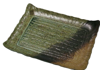
⑦筑後 民芸陶器風 (10枚入)