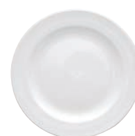
⑥洋皿 丸19 白磁 (25枚入)