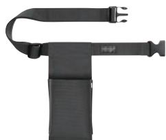
⑪ワーキングホルダー 1P ⑪