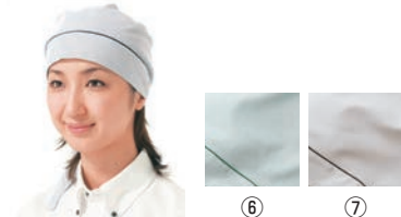
三角巾 ⑥ ⑦