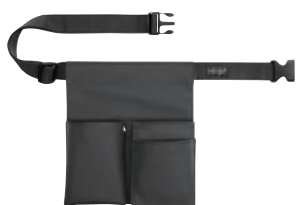
⑫ワーキングホルダー 2P+1P ⑫

外寸:95×230 材質:ナイロン(裏PVCコーティング)・ポリプロピレン・ 合成樹脂・真鍮ハトメ ●ハンディーターミナル用腰袋 ●ウエストサイズ68~100cmまで対応 ●ストラップ用ハトメ付き