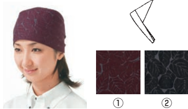
三角巾 ① ②