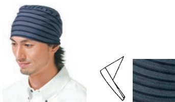
⑧三角巾 KA0070-1 紺 ⑧