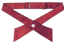
⑨クロスタイ JX4830-2 ワイン ⑨