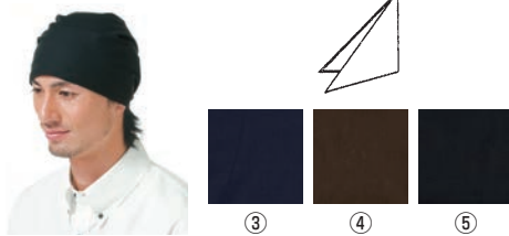
三角巾 ③ ④ ⑤