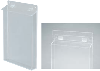
① アクリルパンフレットケース A4