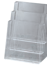
③ カタログホルダー 3C230 (A4判3段)