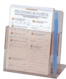
⑫ えいむ ハガキアンケート スタンド