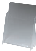
⑦ カタログホルダー A190 (B5判)