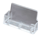
㉒ 名刺立て BC93 (横置き)