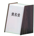
㉓ 木目 貴名受