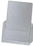
⑤ カタログホルダー C230 (A4判)