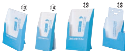
ペーパーリーフスタンド