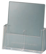
⑨ パンフレットスタンド