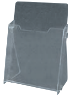
⑥ カタログホルダー A230 (A4判)