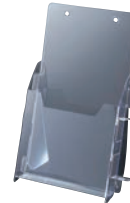
⑪ アンケートスタンド A110