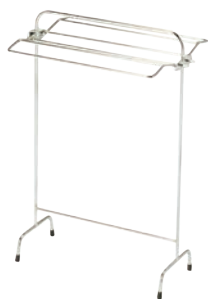
④タオル掛け S-1 ㊦

電源:単相100V 消費電力:38W コード長さ:1.8m ●竹で編み上げてあり、一層の雰囲気を出します。