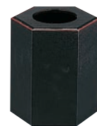
⑩ウレタン 六角千筋 屑入 ㊦