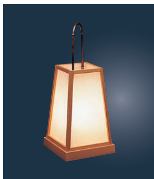
①路地あんどん 錦 ㊦