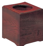
⑧和風ケヤキスリ 屑入 ㊦