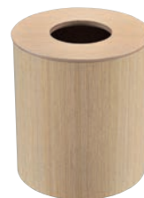
⑥ホワイトオーク ダストボックス 蓋付 ㊦

外寸:385×220×H490 材質:スチールクロームメッキ 折りたたみ式、タオル6枚掛