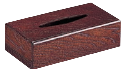
⑫ケヤキスリ ティッシュ BOX (L) ㊦