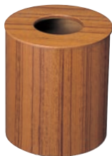
⑦チークダストボックス 蓋付大 ㊦