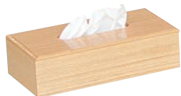
⑪白木ティッシュケース ㊦