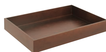
⑭ケヤキ合板 衣装盆 ㊦ ㊦A