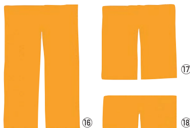
半間用 無地 のれん あかね