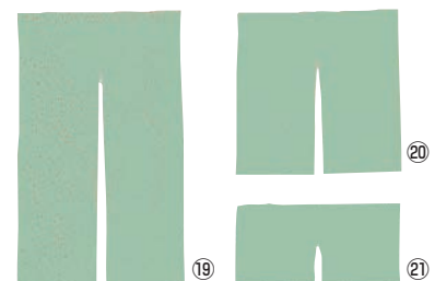
半間用 無地 のれん グリーン