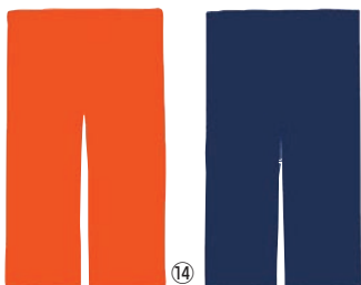
半間用 綿つむぎ 無地 のれん