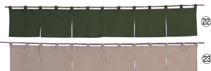
綿麻無地 のれん 001-09