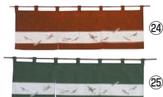
のれん 松葉ちらし 118-01