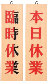
⑤ 木理-7 本日休業・臨時休業