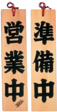
① オープンプレート ひのき 準備中