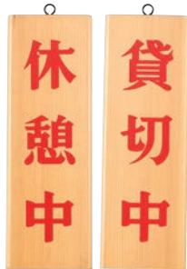
⑥ 木理-8 休憩中・貸切中