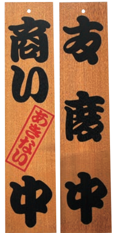
⑧ けやき 商い中