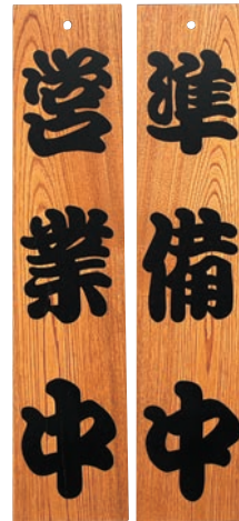
⑦ けやき 営業中