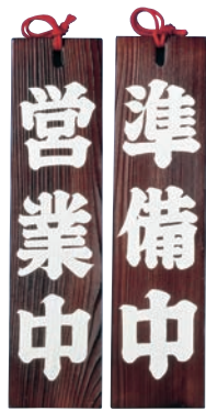
② オープンプレート 焼杉 営業中