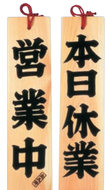
④ オープンプレート ひのき 本日休業