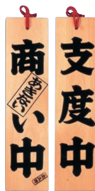
③ オープンプレート ひのき 商い中