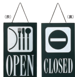
④ えいむ オープン・クローズプレート ブラック 加