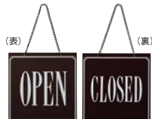
⑨ えいむ オープン・クローズプレート ブラウン 加