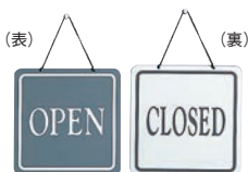
⑪ オープンプレート 加