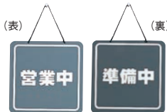
⑫ 営業中プレート 加