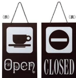
② えいむ オープン・クローズプレート ブラウン 加