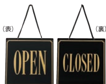
⑧ えいむ オープン・クローズプレート ブラック 加