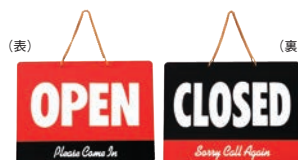
⑩ カナディアン オープンプレート 加