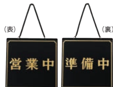
⑥ えいむ オープンプレート 営業中・準備中 黒 加