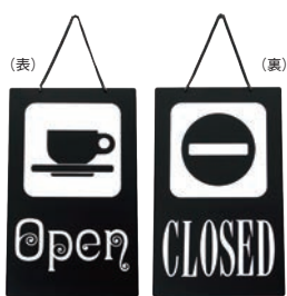
① えいむ オープン・クローズプレート ブラック 加