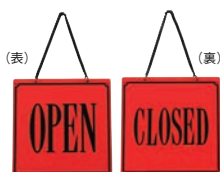
⑤ えいむ オープン・クローズプレート レッド 加