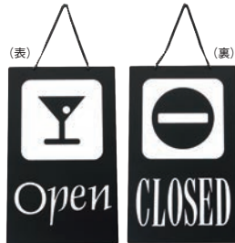
③ えいむ オープン・クローズプレート ブラック 加