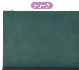
⑤ 壁掛用木製ボード