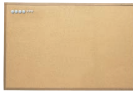
② マグピンコルクボード