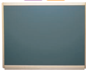
④ ウットーチョークグリーン (壁掛黑板)