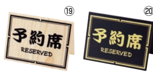
⑲ シンビ 予約席 和-10 ㊦