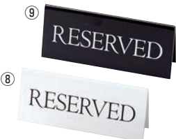
⑧ えいむ リザーブ RY-16 ㊦