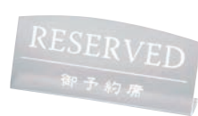
㉔ えいむ テーブルサイン クリアマット ㊦