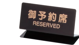
③ シンビ 予約席 ㊦