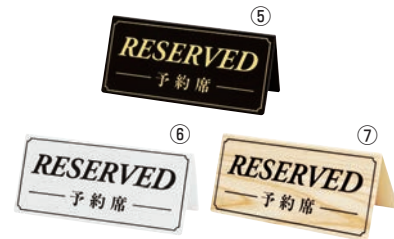
⑤ シンビ 予約席 ㊦