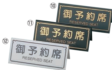
⑩ えいむ A型 予約席 RY-31 ㊦