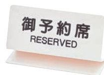
④ シンビ 予約席 ㊦