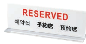
㉒ 多国語プレート 予約席 ㊦