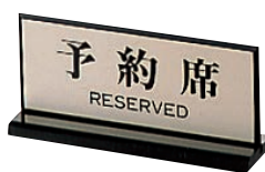
㉓ 両面 予約席 ㊦