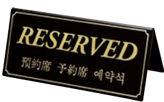
⑱ シンビ 予約席 黒 ㊦