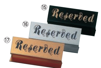
⑮ えいむ Z型 リザーブ RY-41 ㊦