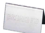
㉖ UK 18-8 テーブルリザーブ カード