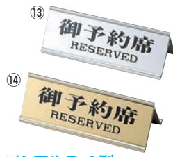
⑬ えいむ アルミ A型 予約席 RY-32J ㊦