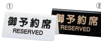
① シンビ 予約席 DS-3 ㊦