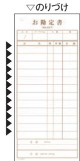
⑨ シンビ お会計伝票 洋風 2枚複写