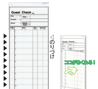
⑬ シンビ お会計伝票 英文 2枚複写 175×80