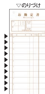
⑫ シンビ お会計伝票 和風 2枚複写