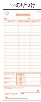
② 単式 会計伝票 消費税対応 (100枚つづり・10冊入)