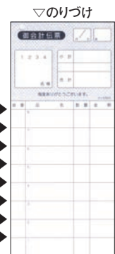
⑩ シンビ お会計伝票 2枚複写