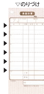
⑧ シンビ お会計伝票 洋風 2枚複写