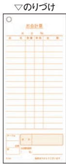
① 単式 会計伝票 (100枚つづり・10冊入)