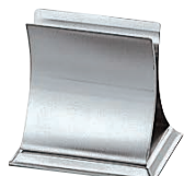
③EBM 18-8 エレガンスメニュー立て幅広