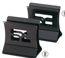
えいむ スチールブックスタンド