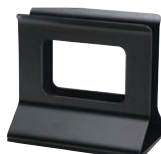
⑩シンビメニューブックスタンド