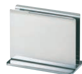
④SW 18-8 メニューブック立てTタイプ