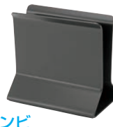
⑭シンビメニューブックスタンドブラック

●スチール素材で安定感があります。 中央部分にデザインを施した格調高い商品です。